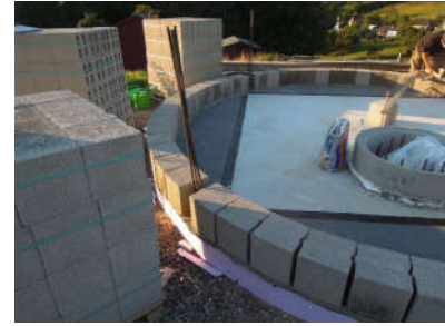
Bau des Teleskopturms.

Trotz bisher großer Erfolge in der schulischen und wissenschaftlichen Arbeit leidet unsere Arbeit noch immer massiv unter einer völlig fehlenden finanziellen Unterstützung. Abgesehen von der anstehenden Installation des zweiten Instruments ist ein geregelter Beobachtungs- und Ausbildungsbetrieb unter den aktuellen Bedingungen kaum umsetzbar. Alle Ankäufe und Aktivitäten wurden bisher zu 100% von den Initiatoren finanziert (im Fall des Teleskopturms durch einen großen Privatkredit). Nichtsdestotrotz ist die Unterstützung einzelner Personen in der Region und damit einhergehend ein signifikanter geldwerter Vorteil nicht zu unterschätzen. Mit ihrem Einsatz halten diese Personen die Kosten in einem Rahmen, der weitere Erfolge überhaupt erst ermöglicht.