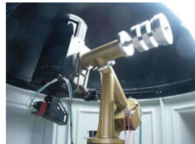
Das neue Teleskop am STScI. vom Kopernikus-Gymnasium in Wissen messen am Teide.