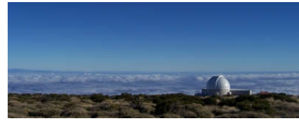
In 2500m Höhe am Teide-Observatorium.